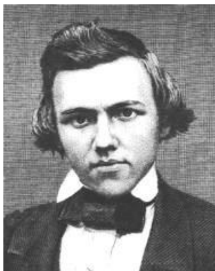
(Paul Morphy 1837 - 1884)

Natuurlijk hebben de tegenwoordige topspelers meer kennis van het spel dan hun voorgangers van decennia geleden. Maar dat is niet de vraag waar het om gaat. Zouden de oude meesters bij gelijkblijvende kennis ook nu domineren? En dat is nog maar zeer de vraag. Statistisch gezien zijn alle huidige toppers allemaal van het niveau van hun beroemde voorgangers en zouden ze vijftig jaar geleden als uniek zijn benoemd.