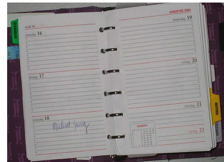
Wedstrijdleider, Roel Spier

29 mei – laatste ronde RAPID-schaaktoernooi, bij Krommenie